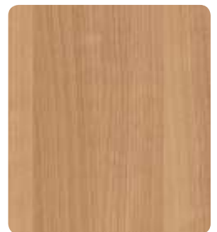
Morena Kirsche H1615