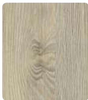
Pinea Silver H3431