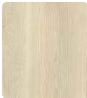
Pinea Creme H3430