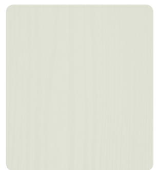
Effekt grau (Holz) U708