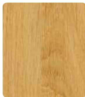
Eiche Natur H3395