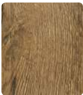
Fachwerk Eiche Tabak H1181