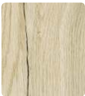
Fachwerk Eiche Sand H1176