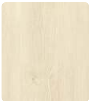
Pinea Snow H3433