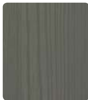
Effekt Onyxgrau (Holz) U960