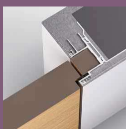
Modell TUS Frameless Zarge In die Leibung öffnend