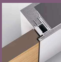
Modell TCSF Frameless Zarge In die Leibung öffnend