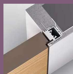
Modell TST-Pivot Frameless Zarge In die Leibung öffnend / Stumpf einschlagend, ohne sichtbaren Zargen-Rücksprung