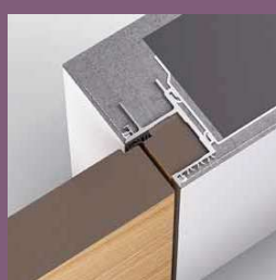
Modell TUT Frameless Zarge Stumpf einschlagend