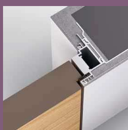
Modell TCS Frameless Zarge In die Leibung öffnend