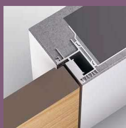
Modell TCT Frameless Zarge Stumpf einschlagend

Das in das Zargenprofil einklickbare Putzgewebe ermöglicht eine feste Verbindung von Türelement zu Mauerwerk und verhindert die Entstehung von Haarrissbildungen. Die durchdachte Konstruktionsweise und das spezielle Zubehör ermöglichen eine schnelle und nutzerfreundliche Montage.