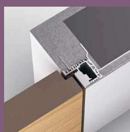
Modell TST Frameless Zarge In die Leibung öffnend / Stumpf einschlagend